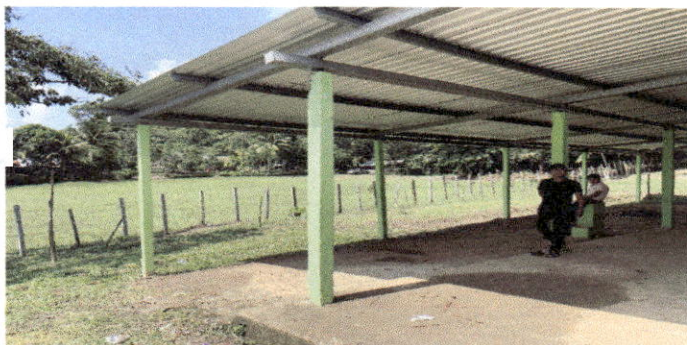
Foto 11: Lugar en donde se realizara remozamiento de techo y piso.