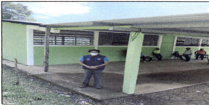
Foto 9: Ingeniero en lugar donde se encuentra la estructura en malas condiciones.