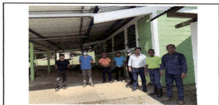
Foto 12: OPF junto a director e ingeniero evaluador.

Firma y sello del Presidente de la OPF ALDEA CAQUIYA, COBÁN, ALTA VERAPAZ Consejos Educativos MINISTERIO DE EDUCACIÓN E.O.R.M. ALDEA CAQUIYA