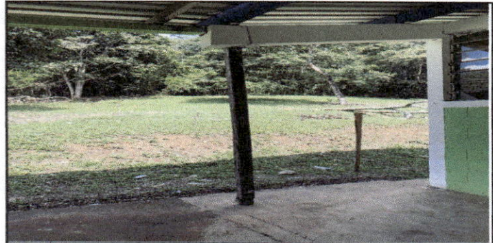
Foto 8: Lugar donde se va a realizar remozamiento de estructura y lamina.