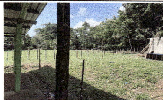
Foto 6: estructura de lamina es de madera y se encuentra en malas condiciones.

[Handwritten Signature] Consejo Educativo MINISTERIO DE EDUCACION E.O.R.M. ALDEA CAQUIYA, COBAN, ALTA VERAPAZ